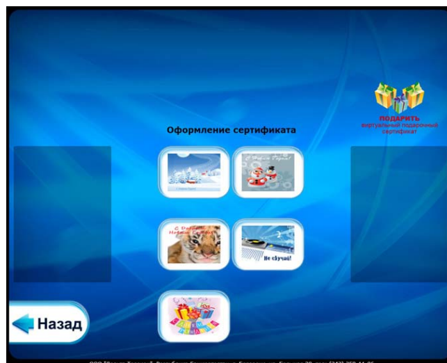
Выбор оформления сертификата