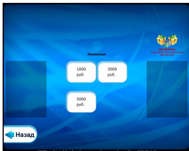
Выбор номинала сертификата

Реализована поддержка реквизитов опционального выбора для всех типов интерфейса программы. Примером оператора, поддерживающим реквизиты опционального выбора, является «Продажа виртуальных подарочных сертификатов».